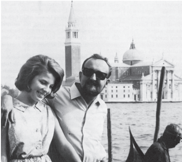
Fot. 2. Elżbieta i Krzysztof Penderecki w Wenecji 1966